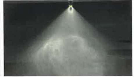
Ainult herbitsiid, 200 l/ha, rõhk 2 baari