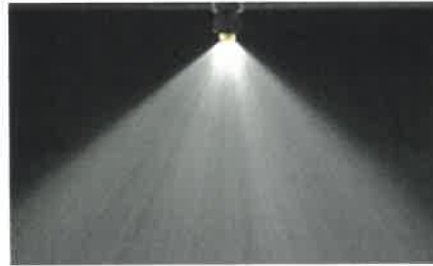
Herbitsiid + GROUND ® , 200 l/ha, rõhk 2 baari