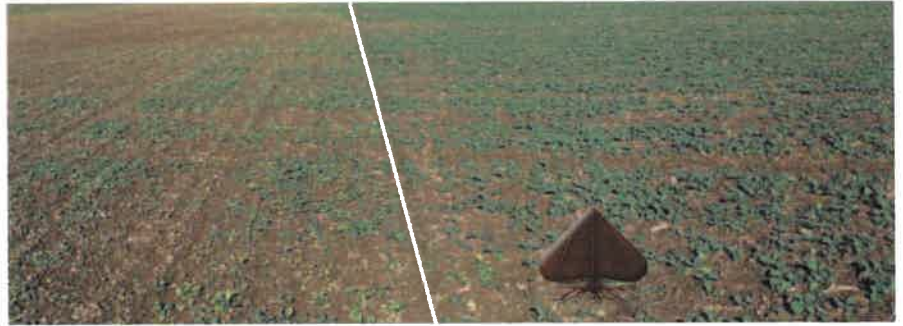
GROUND ® vähendab oluliselt rapsi lehtede valgenemist liiga suure klomasooni sisalduse kasutamise korral.

Pärast GROUND ® kasutamist on võimalik kasvatada kõiki taimi ilma piirangute ta. Arvestada tuleb kasutatud herbitsiidi võimalike piirangutega.